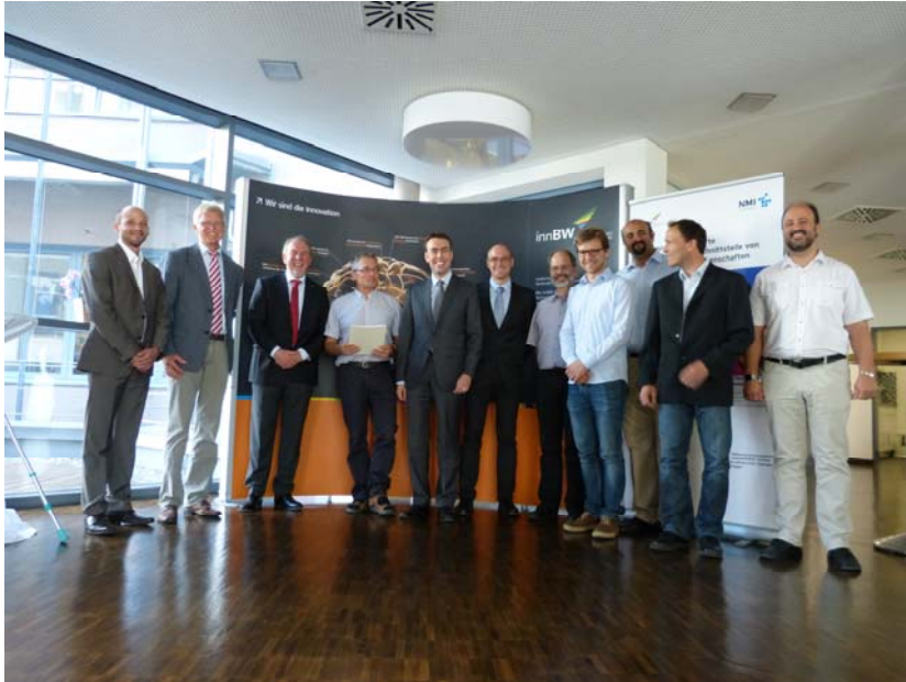
BU.: Dr. Nils Schmid, Finanz- und Wirtschaftsminister des Landes Baden-Württemberg bei der Übergabe des Förderbescheids für das Projekt „innBW implant“